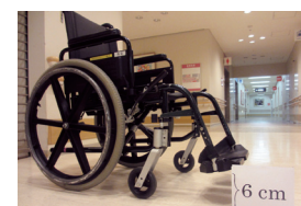
フットレストから床面までの高さを6cm以上確保する

A：①空気圧：圧が不足すると駆動が重くなります。②タイヤの溝：減りの激しいものはパンクやブレーキの効きにくさにつながり危険です。③ブレーキ：ブレーキを掛けた状態で車いすを押しても車輪が動かないか確認して下さい。④キャスター（前輪）：車輪や車軸の糸くずなどを清掃しましょう。⑤フットレストから床面までの高さを6cm以上確保（写真）：低すぎると障害物が当たり、転倒の危険があります。⑥ネジ：各部のネジのゆるみがないか確認しましょう。