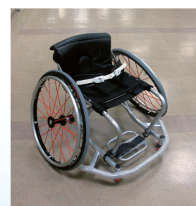
競技用車いす (車いすバスケット用)