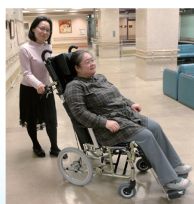
介助用車いす (リクライニング機能付)