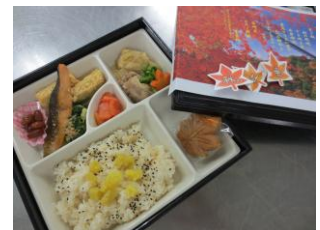
行事食 秋の行楽弁当

飲み込みやすさに配慮した食事です。主に食料はよく煮ると指先でつぶれる食品を選びます。また、肉を叩くなど下ごしらえを加える、塩麴などの酵素を使う、圧力鍋を活用すると軟らかく仕上がります。のど越しをよくするには、あんかけをかけます。毎食あんかけを必要とするときは、汁物に市販のとろみ剤を溶いたものを用意すると手軽です。