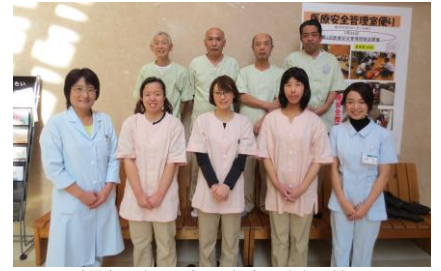
栄養科と日清医療食品㈱の仲間 安全でおいしい食事づくりに奮闘中！

肥満のある方は肥満解消のためQ.6を参考にしてください。また、①減塩、②野菜・果物・乳製品を適量とることが大切です。減塩は、汁物とめん類の回数を減らすのが効果的です。また卓上調味料は思い切って置かないようにします。しょう油を使う料理の味付けは、砂糖やみりんなどの甘みを控えると塩味が際立ちます。野菜は毎食両手1杯、果物は毎日片手分、乳製品は1日1杯が大まかな目安です。