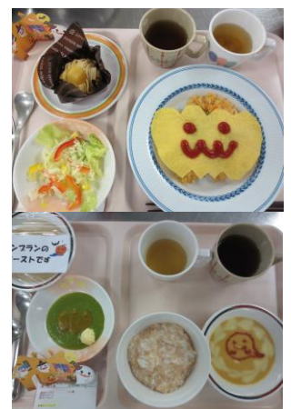
普通食（上）と嚥下食（下）の例 ハロウィンメニュー

おやつに食べたメロンパン1個は約450kcal = おにぎり2個分 運動で消費するには、ウォーキング2時間20分相当です！